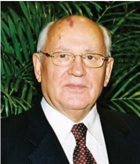
미하일 고르바초프, 전 소련 대통령 / 노벨평화상 수상자 Mikhail GORBACHEV, Former President of the Soviet Union

소비에트 연방의 마지막 대통령 미하일 고르바초프는 '신사고(New Thinking)' 외교를 통해 냉전을 종식시킨 공로로 1990년 노벨평화상을 수상했다. 재임 중 추진한 개혁(perestroika)·개방(glasnost) 정책은 소련은 물론 동유럽 공산국가들에도 영향을 미쳤다. 1991년 제주를 방문해 노태우 대통령과 한-소 정상회담을 열어 제주가 동북아 외교무대로 부각됐다. 그 이후 미국, 일본, 중국 등 정상들의 제주도 방문과 정상회담이 이어져 정부가 2005년 제주를 '세계 평화의 섬'으로 지정하는 계기가 되었다.