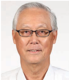
고촉통, 전 싱가포르 총리 / 명예 선임장관 GOH Chok Tong, Former Prime Minister of Singapore

Jim Bolger, the nine-time Member of Parliament from 1972 till his retirement in 1998, served as the 35 th Prime Minister of New Zealand for seven years from 1990 to 1997. He is renowned for his bold reforms of all areas of the country, including government organizations, which eventually led to economic recovery. Bolger has been inspiring many other world leaders as an "icon of reform."