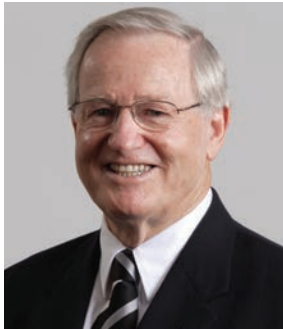
짐 볼저, 전 뉴질랜드 총리 Jim BOLGER, Former Prime Minister of New Zealand

짐 볼저는 1972년 정계에 입문하여 1998년 은퇴하기까지 9선 의원을 지냈으며 1990년부터 7년간 뉴질랜드 제35대 총리를 역임했다. 총리 재임 시절 정부 조직을 포함한 사회 전 분야의 고강도 구조조정을 단행해 침체된 뉴질랜드 경제를 회생시키며 '개혁의 아이콘'으로 많은 국가 지도자들에게 영감을 주고 있다.