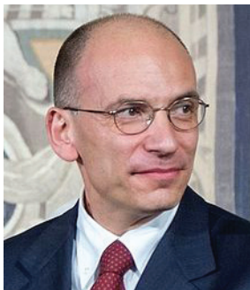
엔리코 레타, 전 이탈리아 총리 Enrico LETTA, Former Prime Minister of Italy

Goh Chok Tong served as Singapore's second Prime Minister for fourteen years from 1990 to 2004, with his ample experience built during his terms as Minister of Finance, Minister for Trade and Industry, Minister for Health, and Minister for Defense. Despite of series of national crises such as Asian financial crisis in 1997 and SARS outbreak in 2003, Goh has been credited for his skilled managements. After resigning from Prime Minister, he served as Senior Minister and Chairman of the Monetary Authority and currently holds title of Emeritus Senior Minister of Singapore.